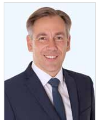
Alexander Tritthart Landrat Erlangen-Höchstadt „Nutzen Sie die Impfangebote vor Ort!“